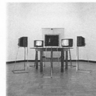
'Bien Trouvé' video, hout, staal, Gemeente Museum Arnhem.