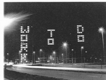
Europoint Complex', 21-12-1985, Rotterdam.

gegevens Objets trouvés worden concepts trouvés . Zij maakt niet in de traditionele zin, de inventie is niet het gevolg van ijverige handvaardigheid. Het gaat andersom. Zij vindt, de nieuwe betekenis dringt zich zelf op. De rest is kritische concentratie. Dat onvoorspelbare moment van vinden speelt zich af in het heldere gat van de mentale gewichtsloosheid. Gertrude Stein formuleerde het zo: 'I am I because my little dog knows me but creatively speaking the little dog knowing that you are you and your recognising that he knows, that is what destroys creation.' Je