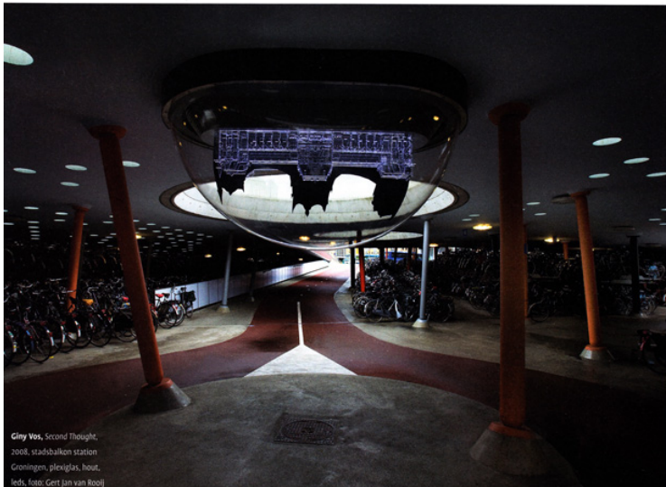
Giny Vos, Second Thought , 2008, stadsbalkon station Groningen, plexiglas, hout, leds, foto: Gerrit Jan van Rooij

Verschuiven en verdwijnen staan bij Vos letterlijk en figuurlijk centraal. Sommige werken verschijnen bijvoorbeeld pas als het donker wordt. En als haar werk dag en nacht zichtbaar is, dan is het