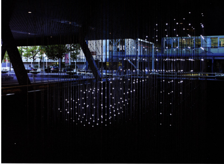
Richtpunten elk opgebouwd uit zes witte leds, computer, foto: Gerrit Jan van Rooij